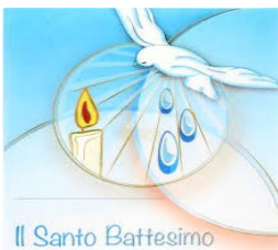
Il Santo Battesimo